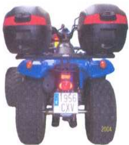
"Quads" Vehículos Automóviles