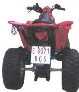
"Quads" Vehículos Especiales