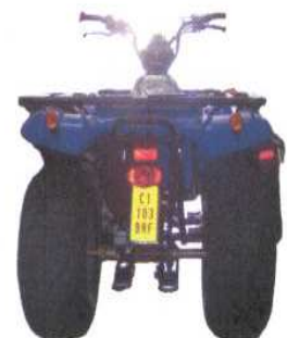
"Quads" Vehículos Ciclomotores